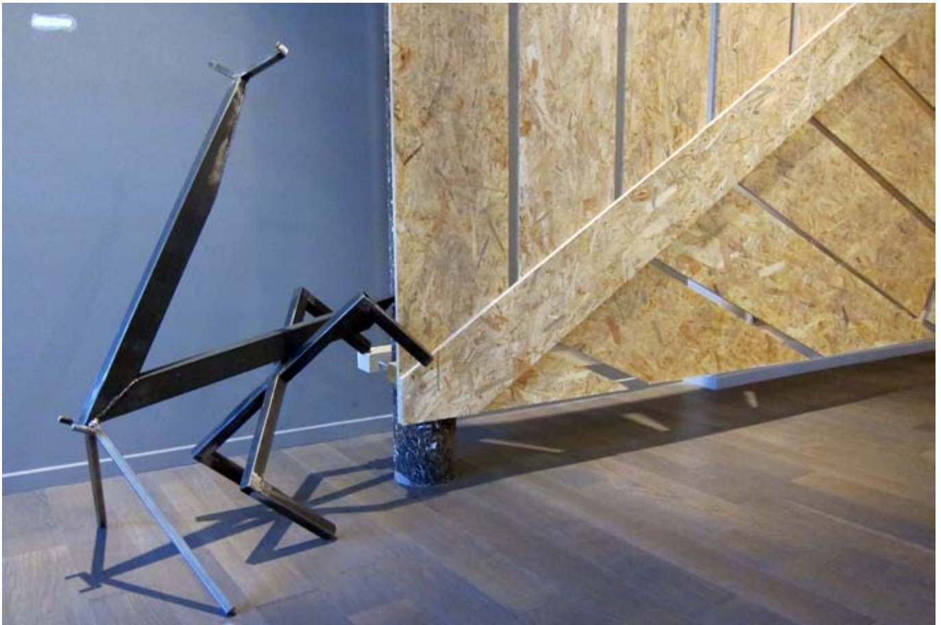
Palissade / 2011/ 430x250x80 cm / OSB, métal, fourche de vélo Acte sec / 2011 / 80x100x60 cm/ métal. Exposition personnelle, Espace TOGU, mai 2011, Marseille.