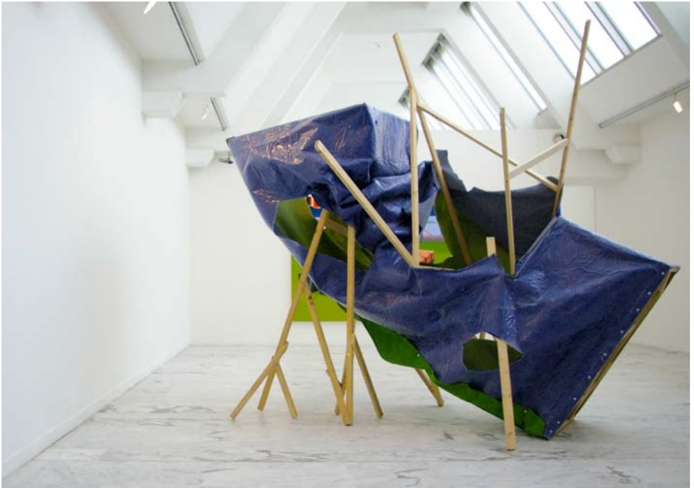
Sous la manche / 2008 / 345x180x260cm / moquette, bois, rivets, vue d'exposition Archipelique , exposition des diplômés 2008, MAC, Marseille.