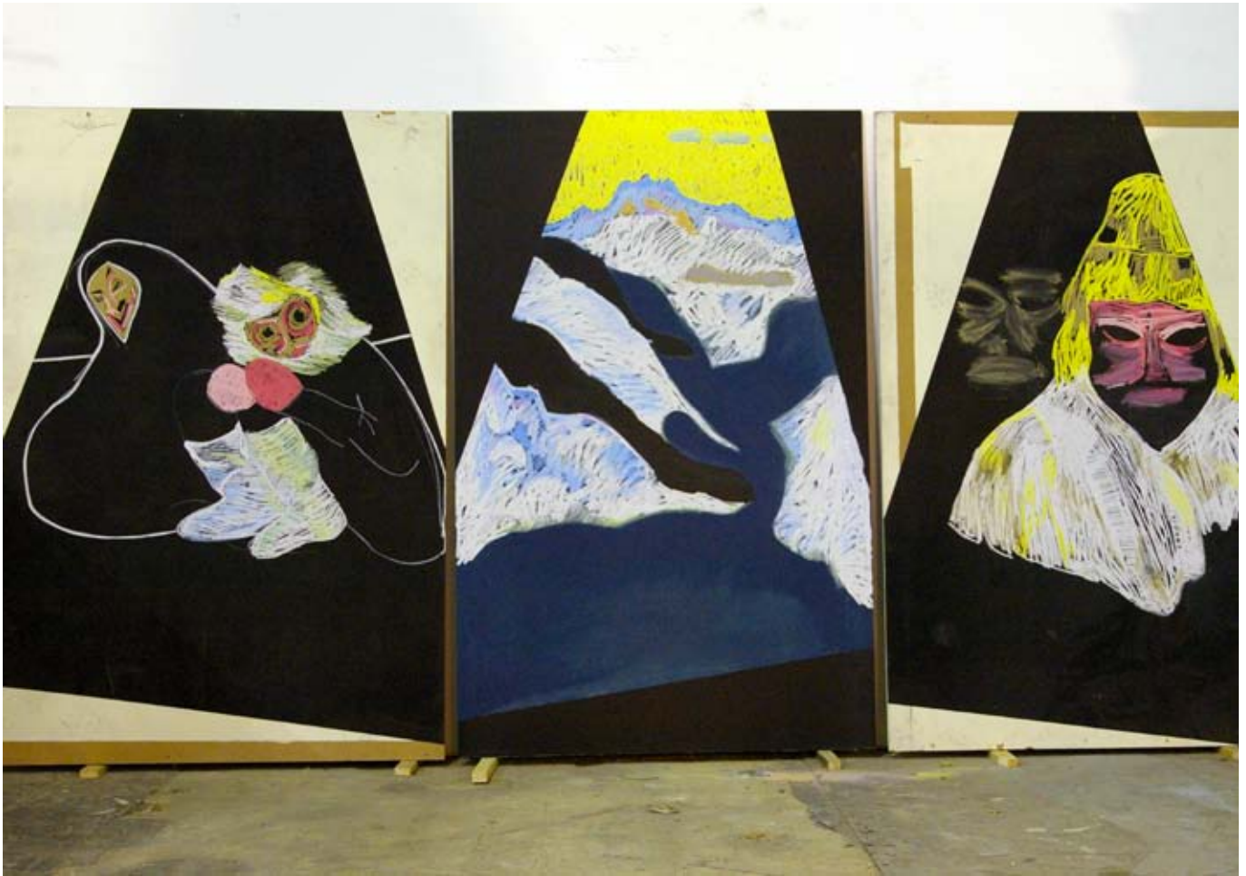
Voyages des autres / 2009/ 180x120 cm chacun / medium, peinture à tableau, craie / Vue d'atelier, Marseille