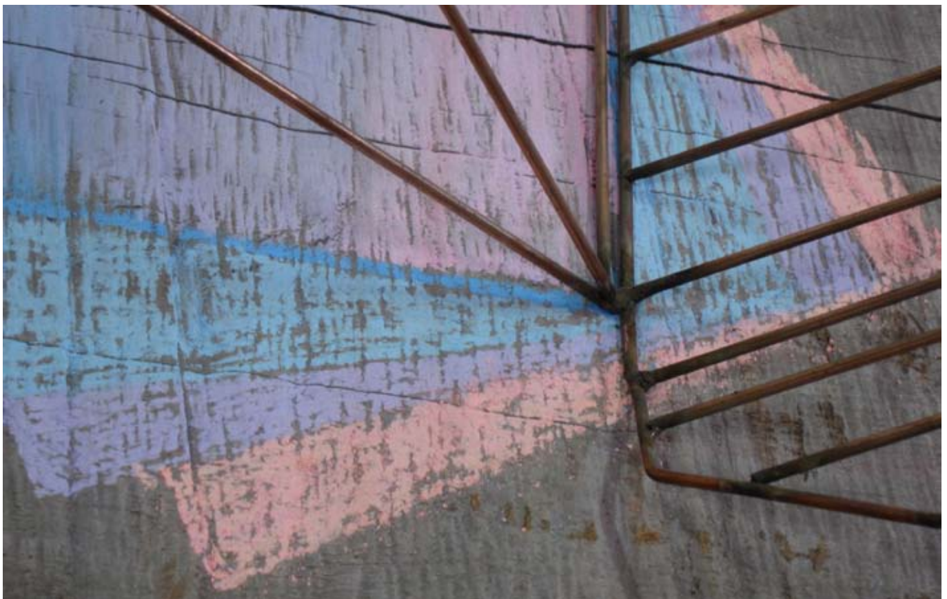
sans titre (mobile stand) / 2010 / 70x40x50 cm/ Cyprès, craie, métal, sciures agglomérée / Vue d'atelier, Marseille.