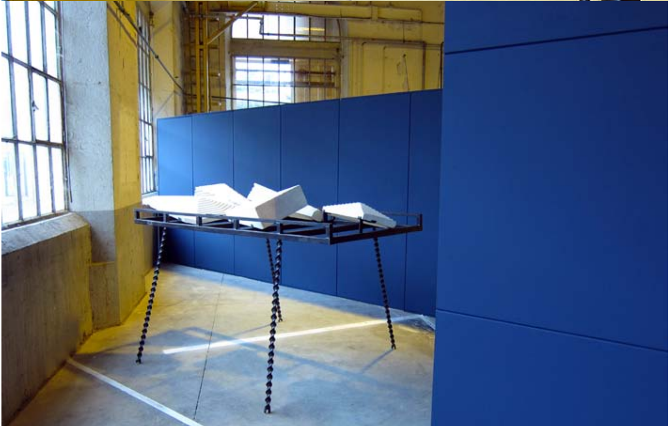
I-Rack stone / 2010 / 130x110x200 cm / métal, pierre d'Oppède. Vue d'exposition "L'Entreprise", Biennale du Design de Saint Etienne, 2010.