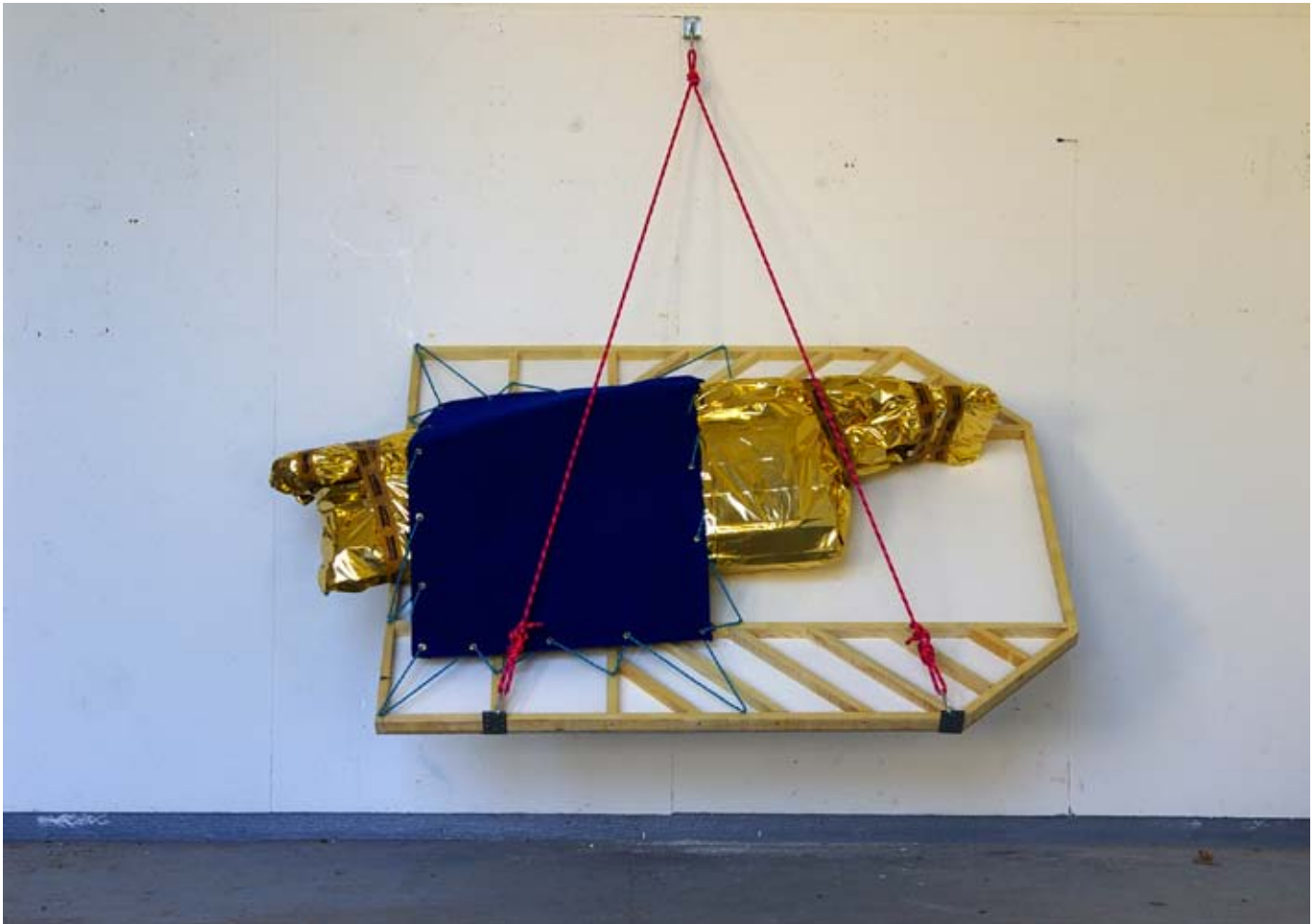
Pique nique à Hanging Rock / 2008 / 180x140x200 cm / couverture de survie, moquette, cordes d'escalades, bois, ruban papier adhésif Hasenkamp, méta / Vue d'atelier, Marseille.