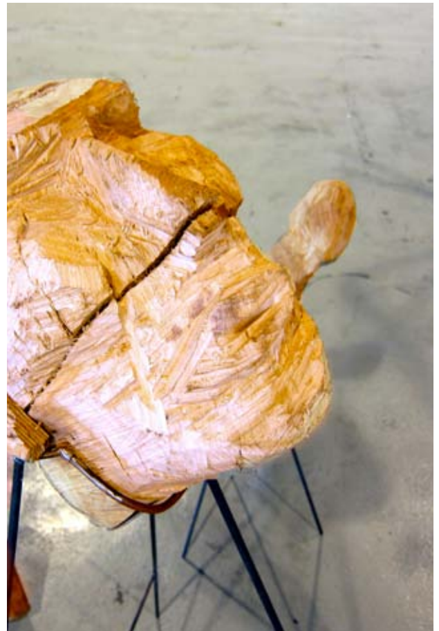
Dider'aus Kahn / 2011 / dimensions variables / eucalyptus, métal / détails, buste et tête. Vue d'exposition Salon international d'art contemporain, Art-O-Rama 2011, Marseille.