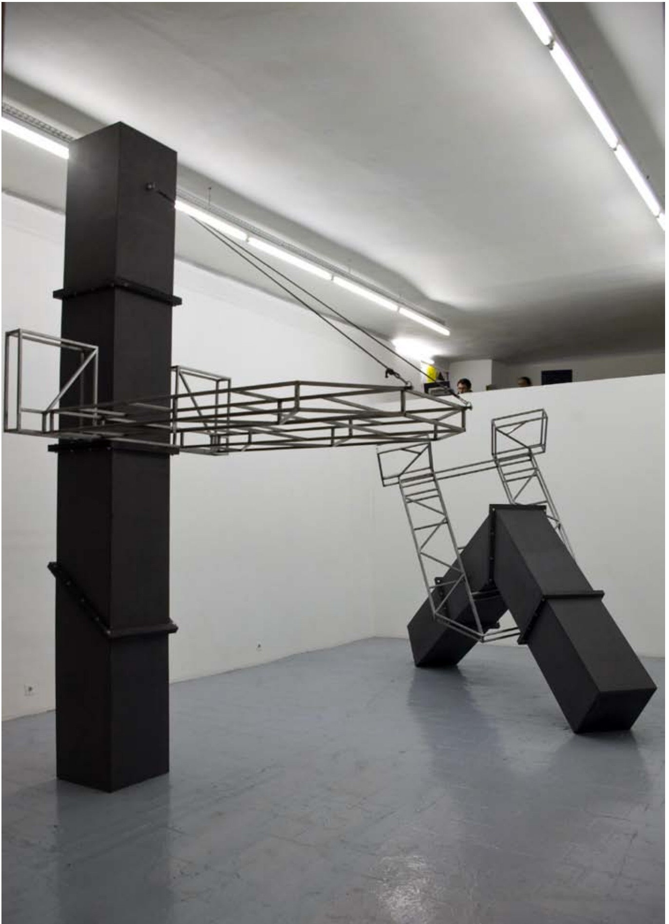
Tour à Tour, variation A et variation B / 2009-2010 / 300x200x160 cm /Topan (médium),cordes, métal / Vue d'exposition " Tour à Tour ", Buy-Self Art Club / Marseille. 2ème volet d'une sculpture en deux temps. 1er temps, exposition " Plus réel que l'herbe #2 "(Low Profile, High Resolution) / Zoo Galerie, Nantes.