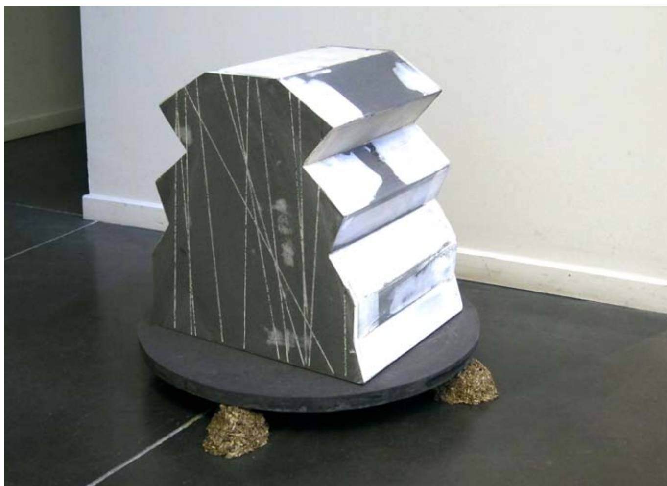
Pratique moderne du rangement / 2010 / 40x30x30 cm / Topan (médium), enduit, sciures agglomérée / Vue d'exposition, Espace Ugot, agence d'architectures Togu, mai 2011, Marseille.