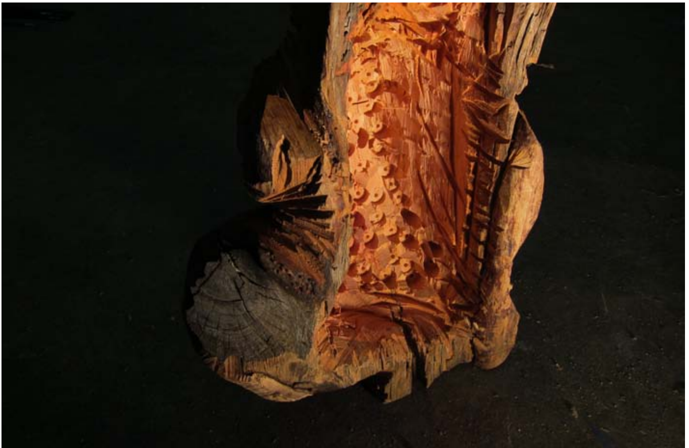
Ex-Voto-triple-B / 2011 / 180x100x90 cm/ métal, eucalyptus, CP. Vue d'exposition "Au fil de la bave", Galerie Alain Gutharc, Paris. Collection Fond Communal d'Art Contemporain de la Ville de Marseille.