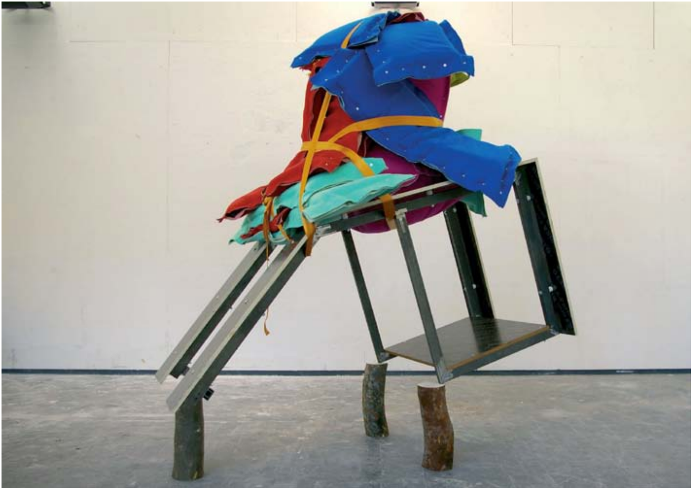
1,2,3 Diet Truck / 2007/ 210x90x200 cm / CP de coffrage, fer, moquette, mousse, billot de bois, sangles / Vue d'atelier, Marseille.