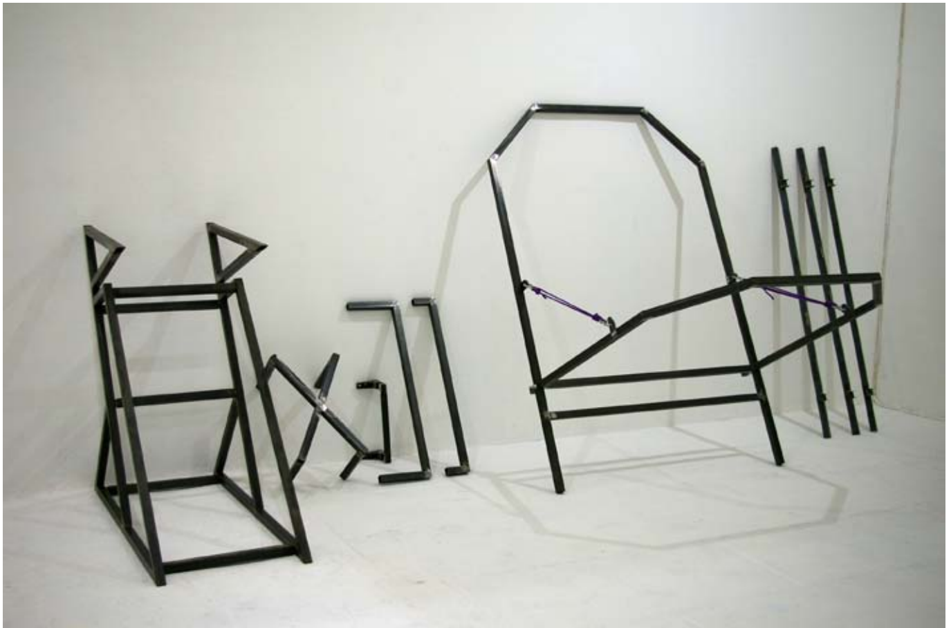
S.E.C / 2009 / dimensions variables/ Fer, cordes d'escalades / vue d'installation Galerie Chateau de Servièrre, Marseille.