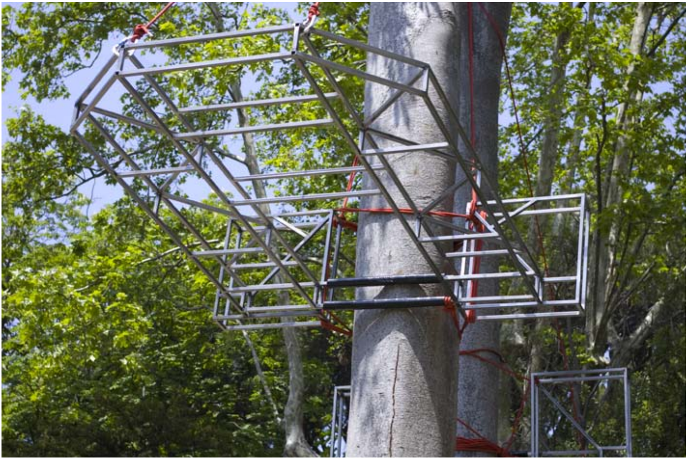
“Tour à Tour, retraite pastorale” / 2010 / 300x200x160 cm / métal, mousquetons, cordes d’escalades / Vue d’exposition “Festival des arts éphémères”, parc de la Maison Blanche, Marseille.