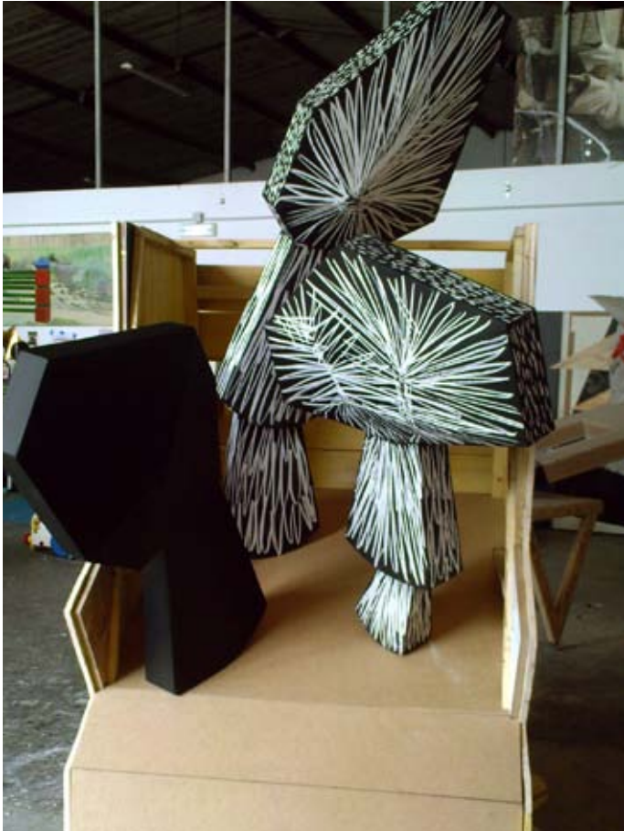
Sans -titre / 2009 / 110x140x205 cm / Voliges, médium, bois, acrylique, craie / vue d'atelier, Marseille.