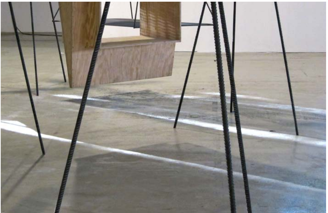
Rack/Racle, learning from "Cripple Creek" / 2011 / dimensions variables / Topan, acacia, craie, noisetier, fer à bétons, CP, toile perforée, poutrelles de coffrages. Salon international d'art contemporain, Art-O-Rama 2011, Marseille.