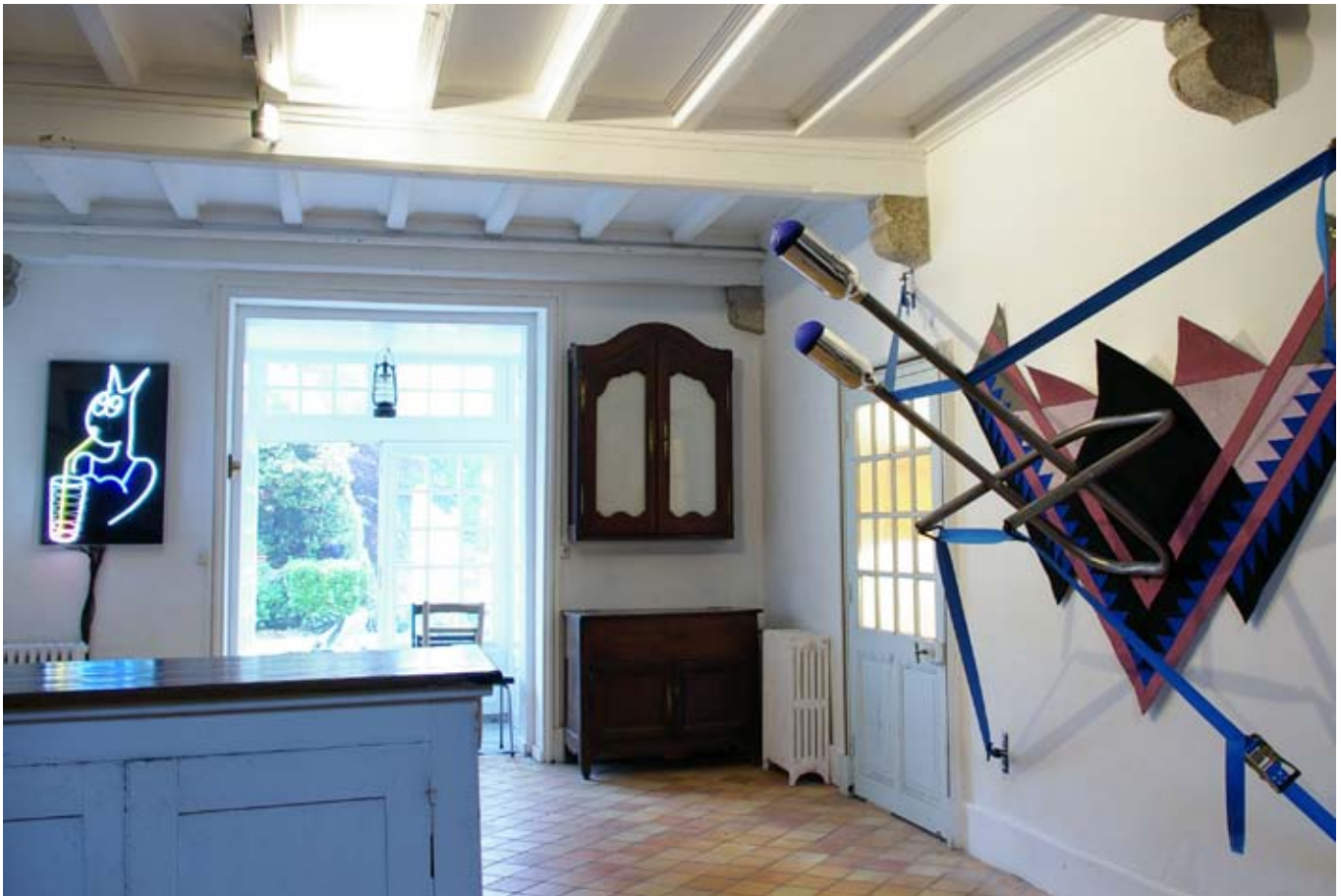
Bad Man Bike Rack / 2007/ 345x120x200 cm/ moquettes, métal, thermos, sangles, acrylique/ Collaboration avec Yann Gerstberger / vue d'exposition " Imbéciles Habitants ", de F.Aubart, P.Bernard, S.Cherpin, Concarneau