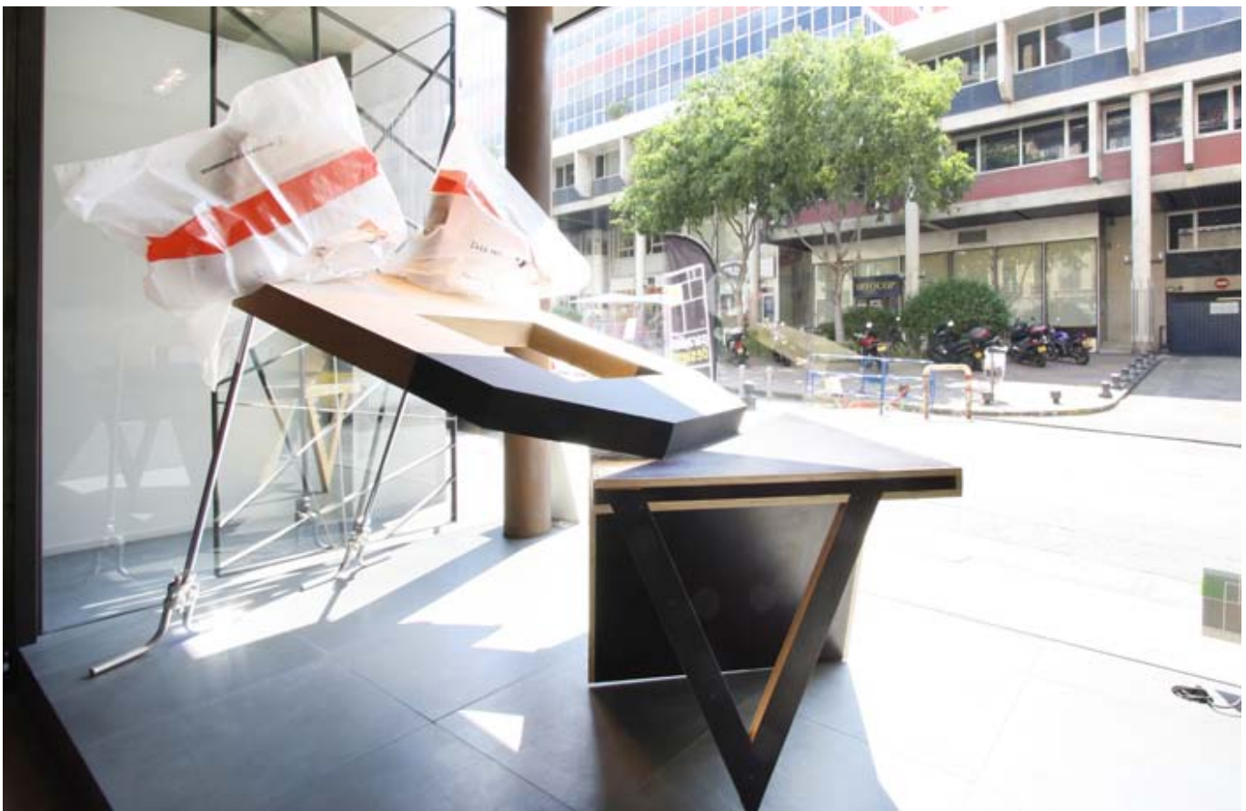
Amiantes sur Table / 2009 / 190x170x160 cm / O.S.B quadri, CP de coffrage, médium, sac de conditionnement de l'amiante, montants chromés Vue d'exposition Espace Ugot, mai 2011/ Marseille.